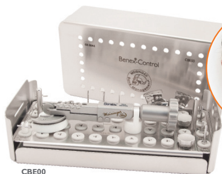
CBE00 Benex ® -Control

Il est presque impossible d'endommager les tissus mous et l'os environnant. En raison de l'extraction longitudinale. Le Benex ® est une base optimale pour l'implantation directe puisqu'il permet une protection tissulaire unique ainsi qu'une protection optimale de l'os.